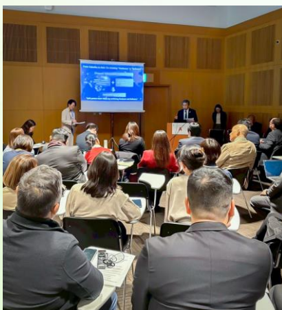
FOF のプレゼンテーションの様子

FOF は昨年8月に国連ハビタット福岡本部と協働に向けた覚書を締結しており、その取組の一環として同セミナーの「共創ネットワークセッション」においてプレゼンテーションを行いました。