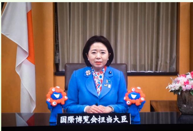
国際博覧会担当大臣 自見 はなこ (ビデオメッセージ)

「いのち輝く未来社会のデザイン」をテーマとする大阪・関西万博を知っていただくとともに、「人と動物の健康と環境の健全性は一つ」というワンヘルスに係る取り組みを推進する福岡県において、ワンヘルスと万博、そしてその先にある未来社会について、一緒に考えていただきたいとの思いが込められています。